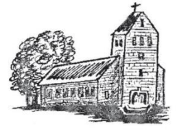
Hüven St. Bonifatius