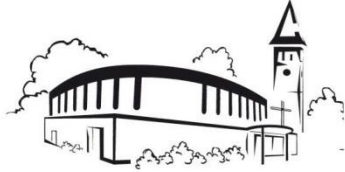
Werpeloh St. Franziskus